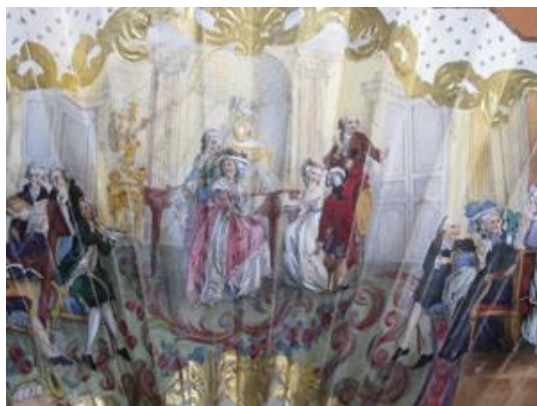
Concert privé - vers 1840