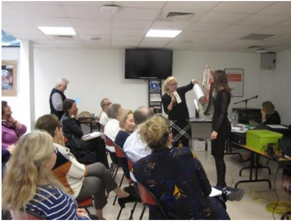
La vente de charité