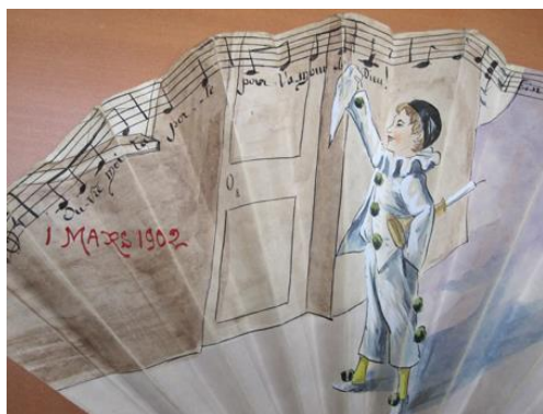
Mon ami Pierrot daté du 1er mars 1902

Son action s'étend dans le monde entier, auprès des collectionneurs avertis ou amateurs, notamment par les liens qu'il entretient avec ses homologues britannique, le FCI (Fan Circle International), américain, le FANA (Fan Association of North America) et allemand, les Fächerfreunde.