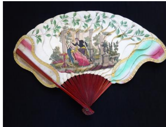
Palmettes quatre images ombré - vers 1825/30