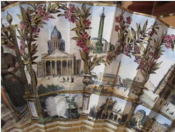
Une famille espagnole en visite à Paris - vers 1840