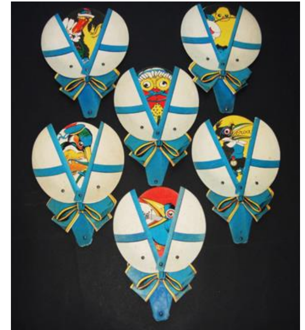
Œufs de Pâques - Éventail du jour - Pâques 2020 Pour les Gands magasins du Louvre - début XX ème

Galliera, musée de la Mode de la Ville de Paris 10, Avenue Pierre 1 er de Serbie 75116 Paris