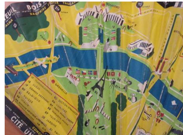
Plan de Paris - exposition internationale de 1937