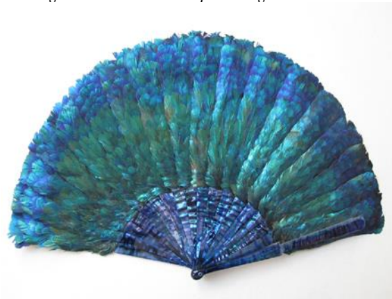
Le lophophore vers 1900/10