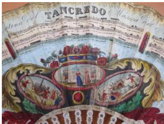
Tancredi - Opéra de Rossini - vers 1825/30